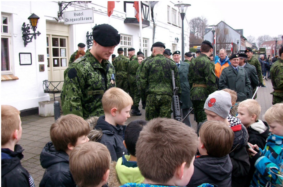
III. 3 150-året for 1864 fejres i Give By. 2014.