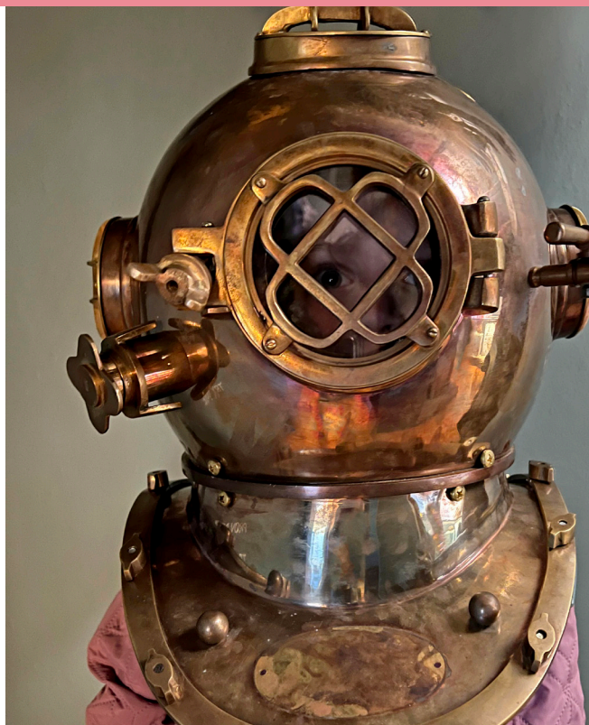
BØRNEHAVER OG DAGTILBUD